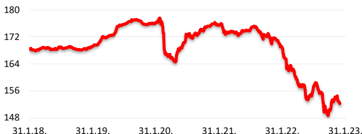
Kretanje cijene udjela HPB Obvezničkog fonda